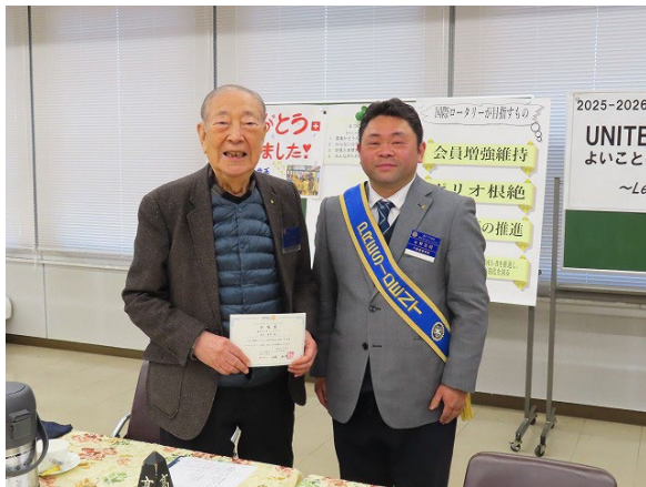
次年度地区役員 高浜PG 委嘱書授与